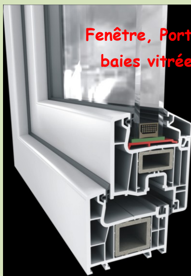
Fenêtre, Portes, baies vitrées

Le titulaire de ce BAC PRO intervient en atelier et sur chantier pour fabriquer et mettre en œuvre différents ensembles constituant des parties de l'enveloppe d'un bâtiment (fenêtres, portes, parties de façade ou de toiture...), des petits corps de bâtiment (vérandas, verrières, oriel...), des ouvrages de distribution et de protection (cloisons, clôtures, garde-corps...) ou de décoration et d'aménagement (cloisons, habillages en miroirs, salles de bains...). Ces interventions concernent des travaux neufs, de réhabilitation ou d'entretien.